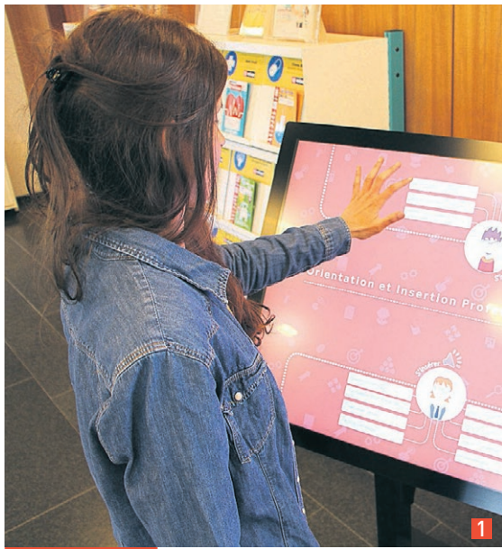
Table tactile (1) et contenus numériques, ateliers ou rencontres comme celles de Réseautage (2)... Les initiatives du SUIO-IP attirent de plus en plus d'étudiants.

De plus en plus sollicité par les étudiants, le Service Universitaire d'Information d'Orientation et d'Insertion Professionnelle (SUIO-IP) de Le Mans Université innove pour mieux les accompagner. Visite guidée.