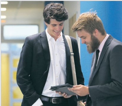
Le Mans Université

Le campus de Laval a également ses atouts ! La proximité avec l'Aquabulle et le Stade Francis Le Basser permet de s'adonner au sport. La cité U du CROUS est au cœur d'un campus verdoyant. Le centre-ville et la gare ne sont pas très loin non plus et trouver un studio à un tarif raisonnable est possible. En 2017, la région Pays de la Loire, le Conseil Départemental de la Mayenne, Laval Agglomération et Le Mans Université ont signé le Schéma Local de l'Enseignement Supérieur, de la Recherche et de