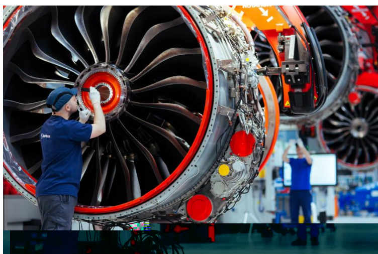
Cyril Abad / CAPA Pictures / Safran