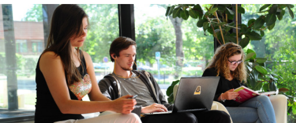
Hall de l'IUT du Mans - Espace de travail et de convivialité